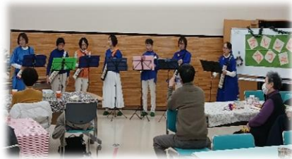
『鍵ハモ CABIN』による楽器演奏 オレンジカフェの様子