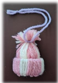
毛糸で作った帽子のチャームマスコット

城山・向陽地域包括支援センターでは、年間を通じて、オレンジカフェを開催しています。是非ご参加ください。