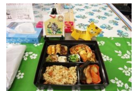
日替わり弁当(要予約)