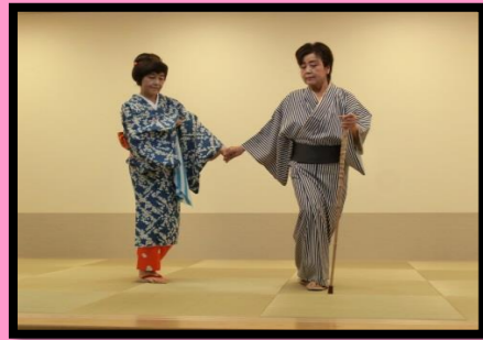
美津路会による舞踊