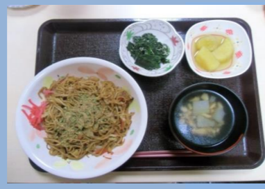
11月 郷土料理 富士宮焼きそば