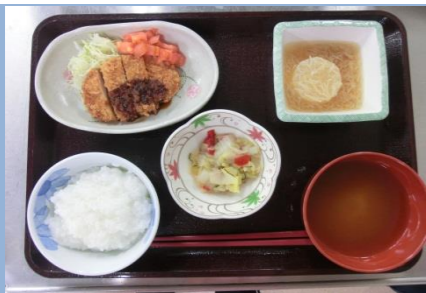
常食(刻みの方は必要に応じて一口大に刻みます。)